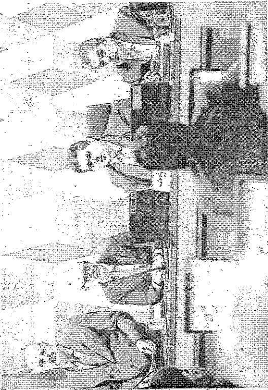
VOTAÇÃO de PEC que limita poderes do STF durou apenas 42 segundos na CCJ do Senado